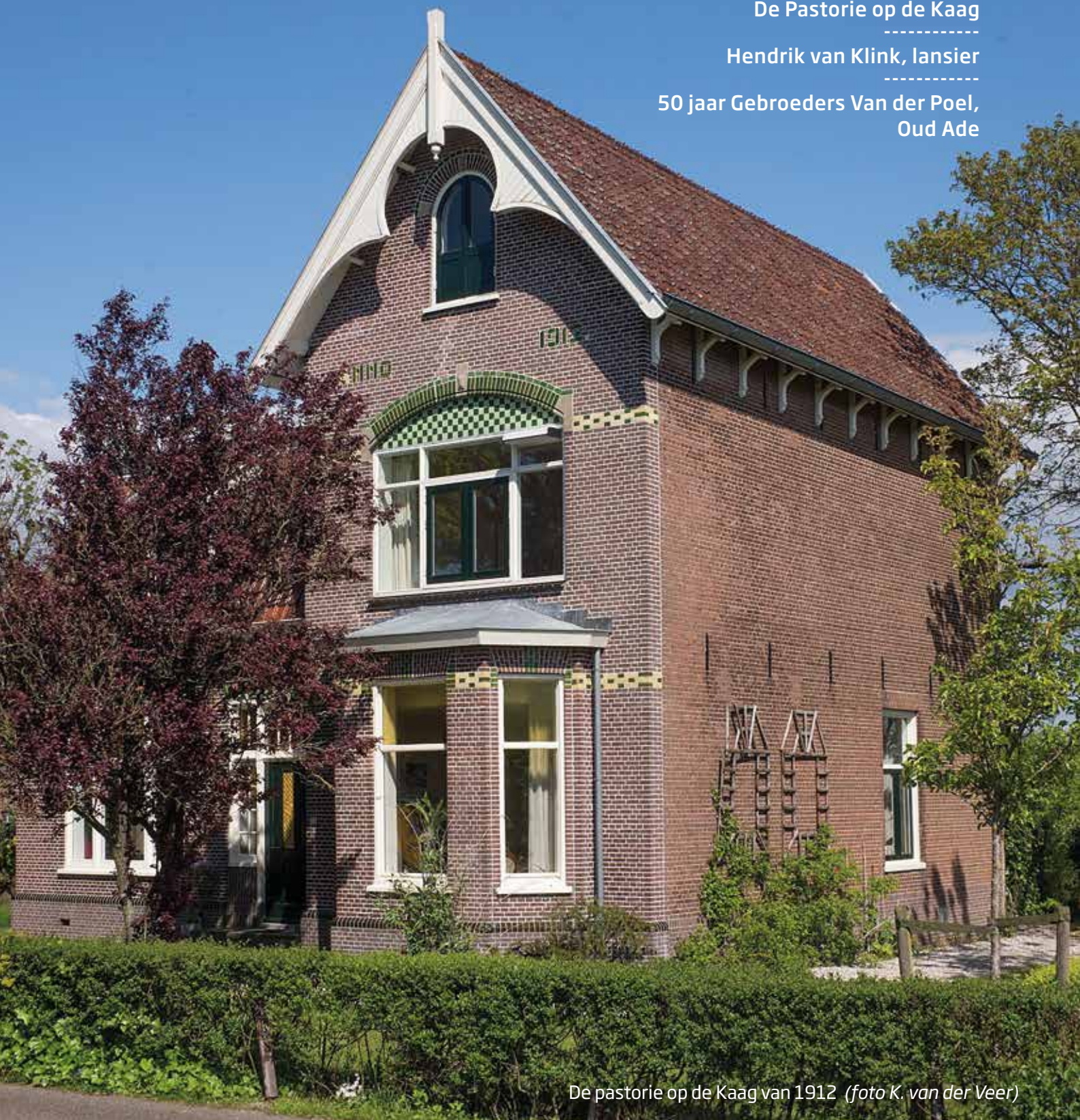
De pastorie op de Kaag van 1912

50 jaar Gebroeders Van der Poel, Oud Ade