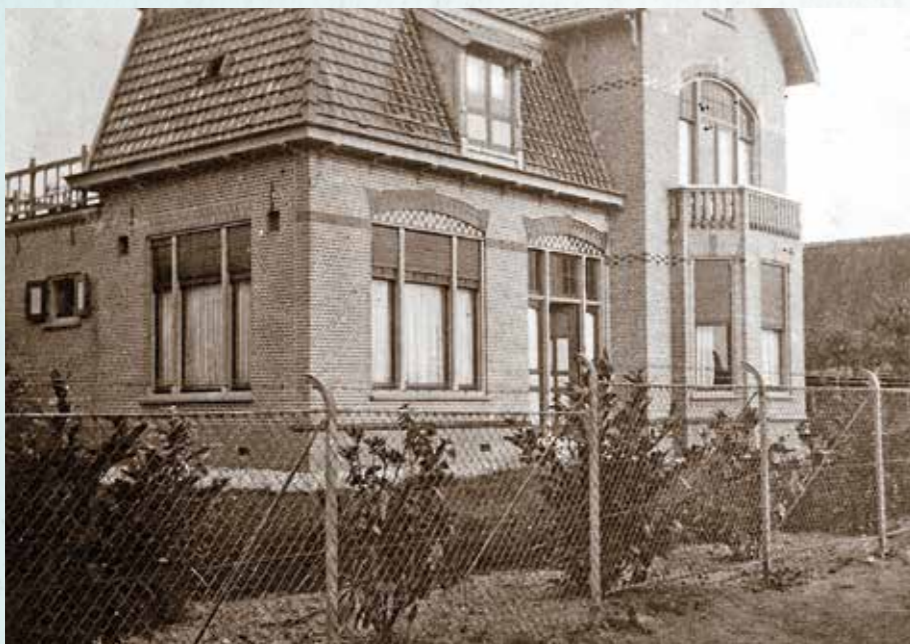
De pastorie in 1912 na de oplevering.