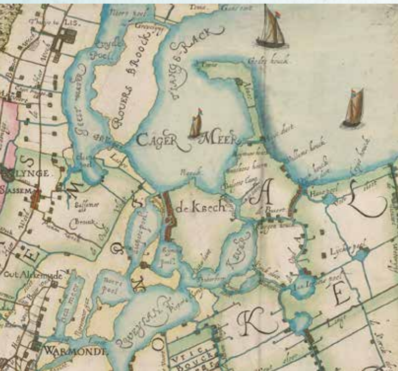
Kaart van Rijnland (gedeelte) uit 1611 met het eiland de Kaag (de Kaech) en ten noorden daarvan het Kager meer (Cager Meer).

De eerste kadastrale kaart uit de periode 1811-1832 toont de locatie van de eerste pastorie uit 1608 (kavel 139). Links van de pastorie zien we de contouren van een laatmiddeleeuwse boerderij, de voorganger van de huidige boerderij uit 1914 (thans de Stal op de Kaag) en geheel rechts (kavel 136) de kerk uit 1618. De gebouwen zijn gelegen aan de Kagerdijk, nu bekend als de Julianalaan, en kijken uit op het Gravenwater. De precieze locatie van de oude kapel is onbekend. Dat is momenteel onderwerp van studie en van archeologisch onderzoek.