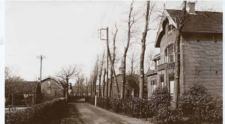
De pastorie met opgaande iepen er voor.

In 1932 wordt de pastorie voor f 185.- aangesloten op de waterleiding en komt