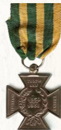
◀ De achterkant van het Metalen Kruis 1830-1831.