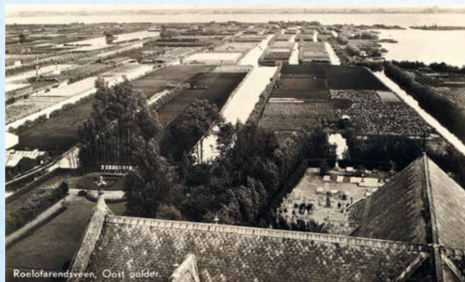
De polder vòòr de ruilverkaveling. Een groot deel bestaat uit water.