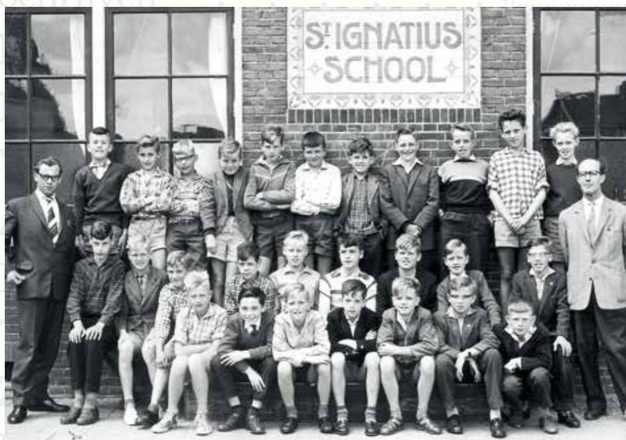
De zesde klas van 1959/60.

Deze foto van de zesde klas van de Rooms Katholieke Lagere School St.-Ignatius zal genomen zijn in het voorjaar van 1960. De leerlingen, allemaal jongens, zijn netjes gekleed, in een zomers overhemd. De meesten dragen een jasje, soms boven een korte broek, maar vaker nog met een keurige lange broek. Natuurlijk kwamen we niet elke dag zo op school; de komst van de fotograaf was van te voren aangekondigd. Er werd een foto van de hele klas genomen, en ook een van elke leerling apart. Als je daar netjes op stond, werd die foto ook gekocht. Eén jongen in die zesde klas draagt een pullover en een wit overhemd met stropdas. Die jongen ben ik.