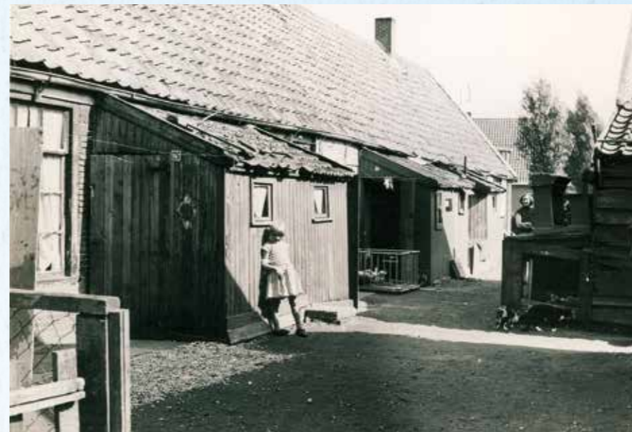
Een van de vele krotwoningen in Roelofarendsveen.

Hoewel van indirect belang voor de tuinbouw, waren de erbarmelijke woontoestanden van meer dan een derde van de tuindersbevolking in Roelofarendsveen voor een groot deel een belemmering voor een in maatschappelijk opzicht bloeiende tuinbouwstreek. Er stonden 262 woningen op de 'krottenlijst'. Voor een belangrijk deel waren hier tuindersgezinnen in gehuisvest. Het uitgangspunt was dat deze slechte woningen, in de volksmond ook wel 'huize-stoot-je-hoofd-niet' genoemd, vervangen zouden worden door nieuwe woningen. Hierbij wilde men zo veel