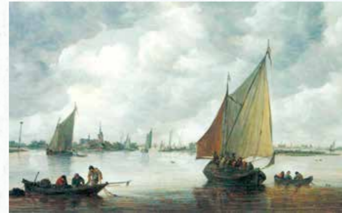
Schilderij van Jan van Goyen (1596-1656): Gezicht op Kaageiland met kerk uit 1618 gezien vanaf het Grote Haarlemmermeer.