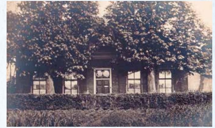
De pastorie uit 1846.

komt leeg te staan. Er wordt waargenomen door predikanten uit Warmond en Voorhout. Deze combinatie werkt niet en in 1842 richt de kerkenraad zich in een verzoekschrift tot koning Willem II om weer een zelfstandige gemeente te mogen worden. Men gebruikt ongeveer dezelfde argumenten als in 1608, dat 'weer en wind het de leraar dikwijls onmogelijk maakt de voorgenomen reis naar de Kaag te ondernemen. Vooral in des winters, als wanneer vorst of storm de toegang tot het eiland de Kaag volstrekt belet, gebeurt het dat de gemeente acht, zelfs negen weken zonder openbare godsdienst-oefening was... Het gaat alzo met de gemeente van de Kaag niet voorwaarts, maar achterwaarts'. Het verzoek heeft vrij snel resultaat. Eind 1844 mag de gemeente een hulpprediker benoemen die in 1845 (tot 1849) op de Kaag komt wonen. Hij vindt er een vervallen kerk en een vervallen pastorie. Maar er is hoop op betere tijden. Immers de droogmaking van het Haarlemmermeer (1845-1852) is in volle gang. Men voorziet een drastische groei van het ledental. In 1846 wordt dan ook een nieuwe pastorie gebouwd. Een karakteristiek pand, dat al heel snel na de bouw gebreken zal gaan vertonen en uiteindelijk geen lang leven beschoren is.