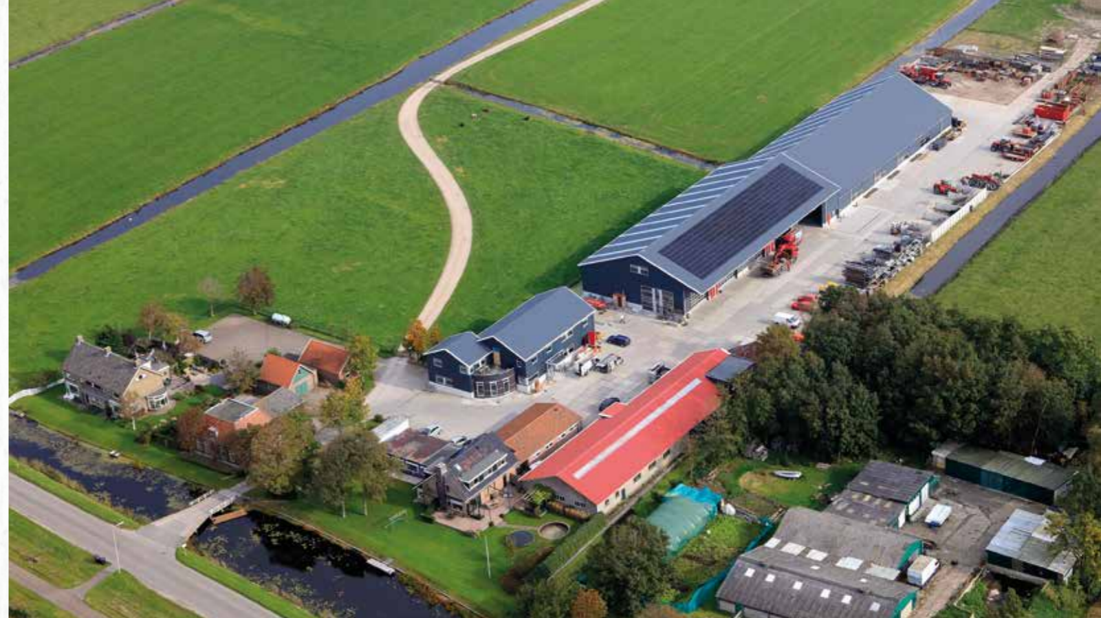
Het bedrijf in 2015.

Op de website ( www.gebrvdpoel.nl ) worden de volgende werkzaamheden gemeld: agrarisch loonwerk, baggerwerken, beschoeiingen, grondwerk, machineverhuur, slotwerk, steiger- en