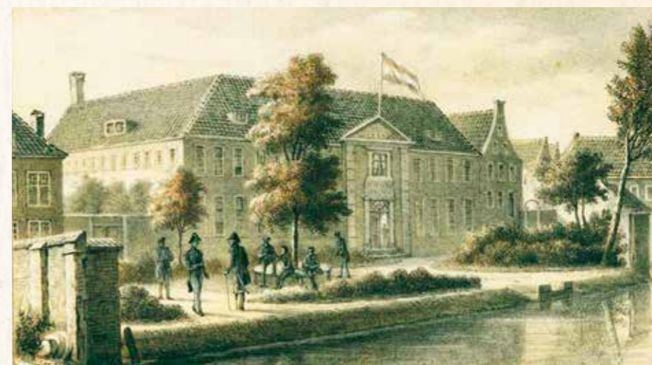
Het Militair Invalidentehuis (litho van H.L. Hoogstraten, 1850).