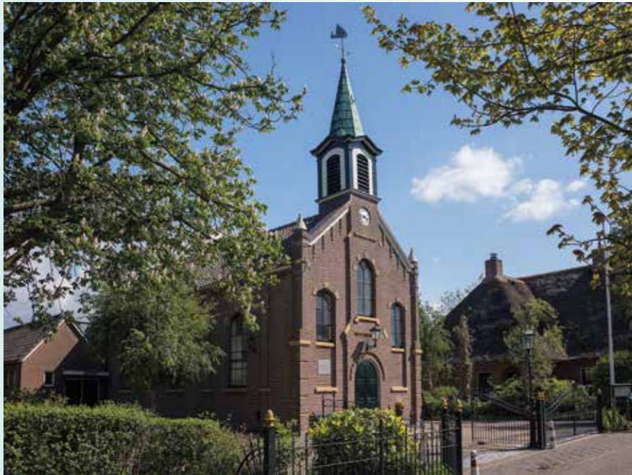
De Kaagse kerk uit 1874 met op toren een kaagschip