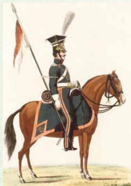
Een lansier van het 10e Regiment Lansiers in vol ornaat.