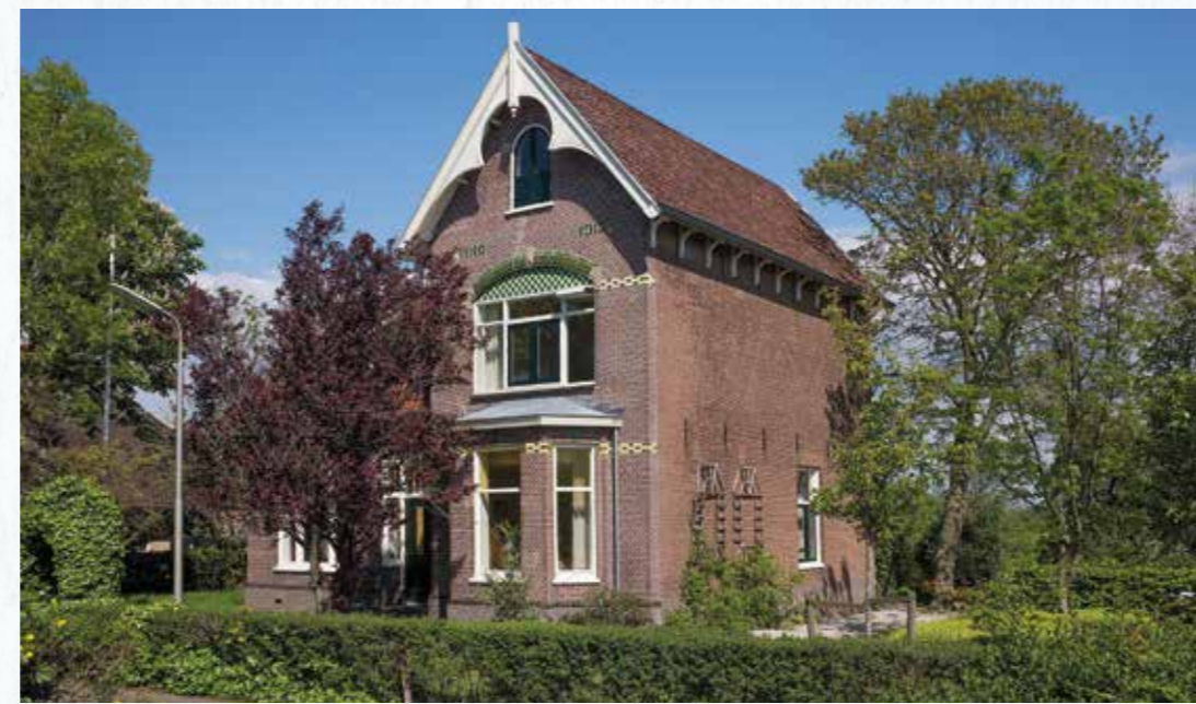
De pastorie op de Kaag van 1912