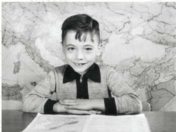
Schoolfoto uit de tweede klas, met de kaart van Europa als achtergrond. Met een glimlach op de foto.

soms ineens wekenlang 'bokkie-springen' was. Als het gevoren had 's winters waagden sommigen zich op het ijs naast het schoolplein: 'ijsie bouwe' ['aisie bauwe'] of 'ijsie piepe' heette dat. Zo'n waaghals zat dan later met 'een natte poot' in de klas. In de zomer was het schoolzwemmen. Dan liep je met je zwembroek opgerold in een handdoek helemaal over de 'Ka' naar het zwembad, en weer terug.